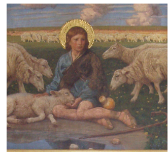
Altertavlen til V. Hæsing Kirke på Fyn forestiller Jesus som den gode hyrde.