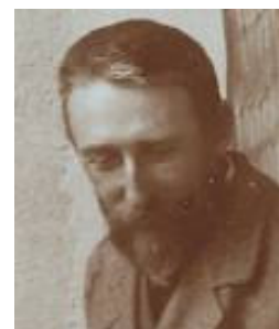
Joakim Skovgaard som cirka 45-årig, omkring 1901.