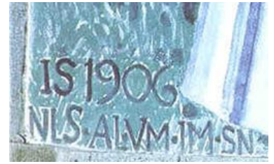
Den sidste fresko i domkirken forestiller Jesus på en tronstol i himlen omgivet af de frelste. I billedets venstre hjørne skrev Skovgaard forbogstaverne på dem, der havde malet billedet.

En anden vigtig medarbejder under arbejdet i domkirken var Skovgaards kollega Thorvald Bindsbøll. De havde arbejdet sammen i mange år. Da Skovgaard begyndte arbejdet på Viborg Domkirke, hjalp Bindsbøll med mange ting. Han fandt på dekorationerne til hvælvene og tegnede skitser til de mangefarvede glasmosaikker.