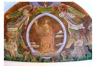
I Lund Domkirke har Skovgaard udsmykket apsis med en mægtig mosaik, der viser Jesus i en mandel-formet glorie. Englene omkring ham hjælper de døde op af deres grave.