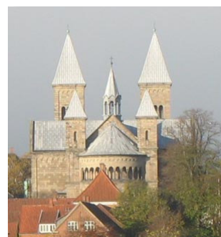
Viborg Domkirke i dag. Sådan har domkirken set ud siden 1876.