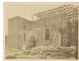
Viborg Domkirke blev revet ned og bygget op igen mellem 1863 og 1876.