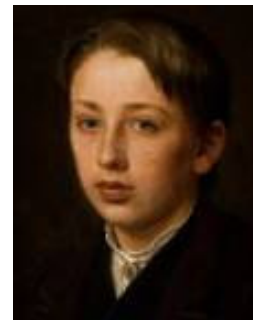
P.C. Skovgaard, Portræt af Joakim Skovgaard, 14 år.

Efter Viborg Domkirke udførte Skovgaard altertavlemalerier og glasmosaikker til mange andre kirker, og i 1924 udsmykkede han apsis i Lund Domkirke med en stor mosaik, der forestiller Kristus i herlighed . Mod slutningen af sit liv gik Skovgaard i gang med at udsmykke Bryllupssalen på Københavns Rådhus med motiver fra danske folkeviser. Skovgaard døde som 77-årig i 1933 og blev begravet på Assistens Kirkegård i København. Seks år før var han blevet udnævnt til æresborger i Viborg.