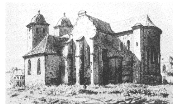
Viborg Domkirke før ombygningen. Tårnene havde små, klokkeformede tage. Folk syntes, at de lignede låg til kaffekander.