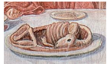
Det er Niels Larsen Stevns, der har malet påskelammet på billedet af den sidste nadver.