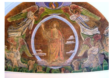
I Lund Domkirke har Skovgaard udsmykket apsis med en mægtig mosaik, der viser Jesus i en mandel-formet glorie. Englene omkring ham hjælper de døde op af deres grave.