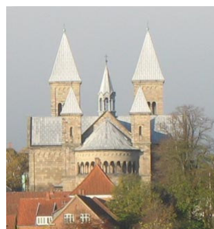
Viborg Domkirke i dag. Sådan har domkirken set ud siden 1876.